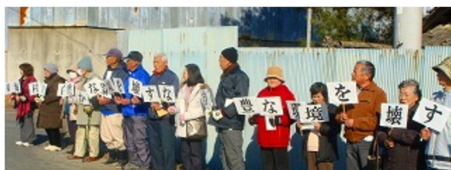
2011年1月 裁判官が川根の現地調査に来村時